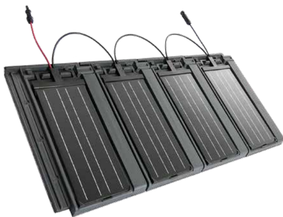
Tuile solaire Panotron PAN 32